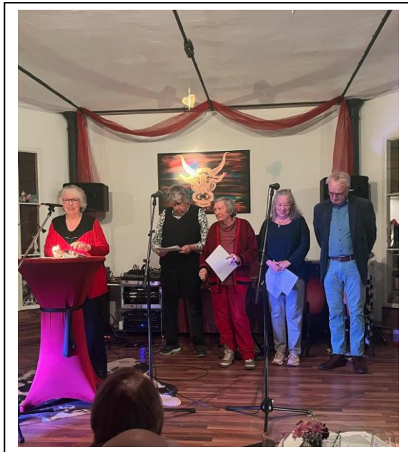
Alle Mitwirkenden auf der Bühne für die Balladenparodien